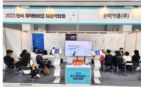
2023 제약바이오 채용박람회

한미약품은 창조와 도전, 혁신 기반의 인재상을 정립하고 공정한 채용 절차에 따라 한미약품과 함께할 인재를 발굴하기 위해 다양한 소통 창구를 운영하고 있습니다. 매년 제약바이오업계 최대 규모의 '제약바이오산업 채용박람회'에 참여하여 적극적으로 활동하고 있으며, 온라인 채용설명회인 '한미약품 채용 TALK'를 통해 취업 준비생들이 공간에 구애 받지 않고 제약산업 및 한미약품의 정보를 얻고 있습니다. 또한 유튜브 채널 '한미약품 TV' 직무 브이로그 등을 통해 현직 사원들의 생생한 직무 설명 등을 제공하고 있습니다.